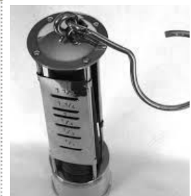
Lampe de mineur