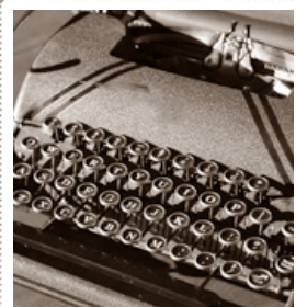
Machine à écrire

Si nous sommes infidèles, il demeure fidèle, car il ne peut se renier lui-même.